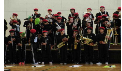
終わった直後！和やかな笑顔