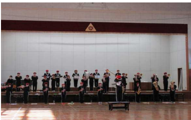
素晴らしい立ち姿で演奏

ところが思いもかけぬ感染症第3波が押し寄せ長野圏域がレベル4となり、「学校における新型コロナウイルス感染症に関する衛生管理マニュアル」に沿って、児童は教室で中継放送視聴、6年生の保護者の皆様には Zoom による配信視聴となりました。鑑賞する人が少ない体育館の中でも、6年生はきりっとした立ち姿で、約45分間、見事なステージ演奏を行いました。6年生の音、姿、そこから感じる思いは画面を通して聴く私たちに伝わりました。6年生ありがとう！