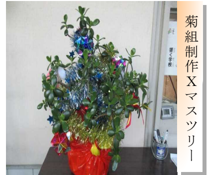
菊組制作 X マスツリー

2学期90日間が本日で終わりました。新型コロナウイルス感染症予防の対応をしながら全校で行った運動会。学年学級での生活・総合的な学習の時間の様子を公開したくぬぎ祭。音楽の時間で学んだ成果を発表した音楽会ウィーク。全てが例年とは違う形で行うこととなりました。しかし、新たな形を見いだす中で、新しい形を見つけることもできた2学期でした。マラソン大会や鼓笛ファイナルコンサート等楽しみにされていた行事が中止となったり、オンライン配信となったりと、保護者の皆様のお気持ちを考えると苦しくなる決断が幾度となくありました。十分な配慮ができなかったことは真摯に反省し、3学期への取組につなげていきたいと思ひます。ご理解ご協力ありがとうございました。