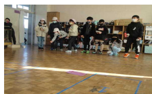
アルミ缶ホッケー

毎年縦割りグループで楽しんだこの会も、今回は時間を分けて、学年毎に楽しみました。校舎中に歓声が響いた一日となりました。