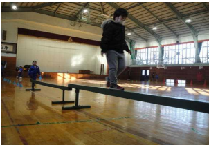
運動マッアストレッチ

今年も児童会行事、キッズフェスティバルが行われました。6年生がいろんな楽しいゲームを企画！新型コロナウイルス感染症予防も忘れずに運営をしていました。