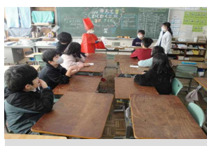
わくわく学校3択クイズ