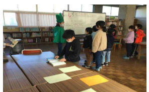
しりとり本探しリレ