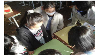
保健給食委員からの挑戦