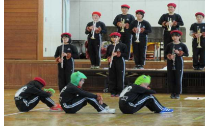
途中コミカルな劇も披露